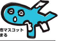
伊丹市マスコット ヒコまる