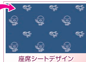
座席シートデザイン