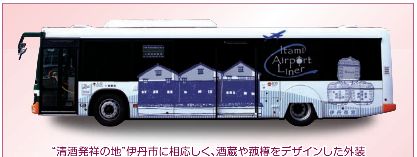
“清酒発祥の地”伊丹市に相応しく、酒蔵や菰樽をデザインした外装