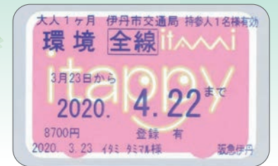
IC定期券の券面イメージ

市交通局は、3月23日(月)、IC定期券・全国相互利用ICカードシステムを導入するとともに、ダイヤを改正します。特に空港便では、直行便に代わりJR伊丹から阪急伊丹を経由し、大阪国際空港へ向かう「伊丹エアポートライナー」を運行します。