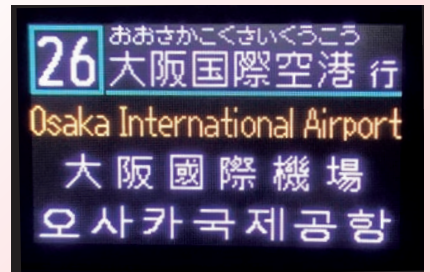
フルカラー行先表示器