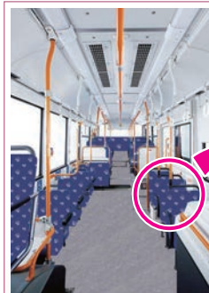
バス内装デザイン