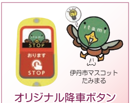
オリジナル降車ボタン